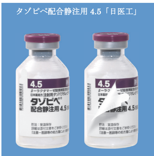
タゾピペ配合静注用 4.5 「日医工」